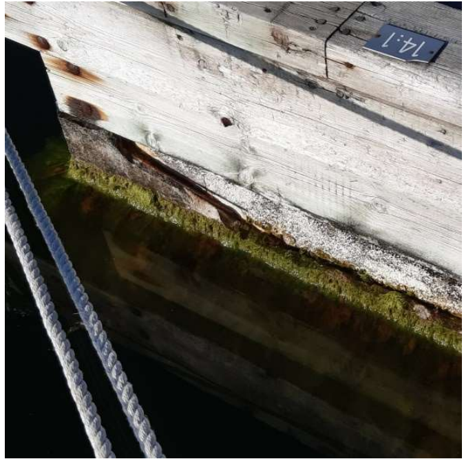
Betonghöljet kring flytkroppen har gått sönder och frigoliten ligger öppenför väder och vind.

Nu har den gamla skrotade flytbryggan från Beckmansviken i Arkösund, som ligger och läcker frigolit ute vid Bergön sedan år tillbaka, blivit en fråga för Mark- och miljööverdomstolen. Ägaren vill ha prövat om den tidigare domen i Mark- och miljödomstolen i Växjö är rätt och/eller om ett skärgårdshemmans fiskerätt kan tvinga en fastighetsägare att ansöka om tillstånd hos Länsstyrelsen för att lägga ut bryggor på annans fiskevatten.