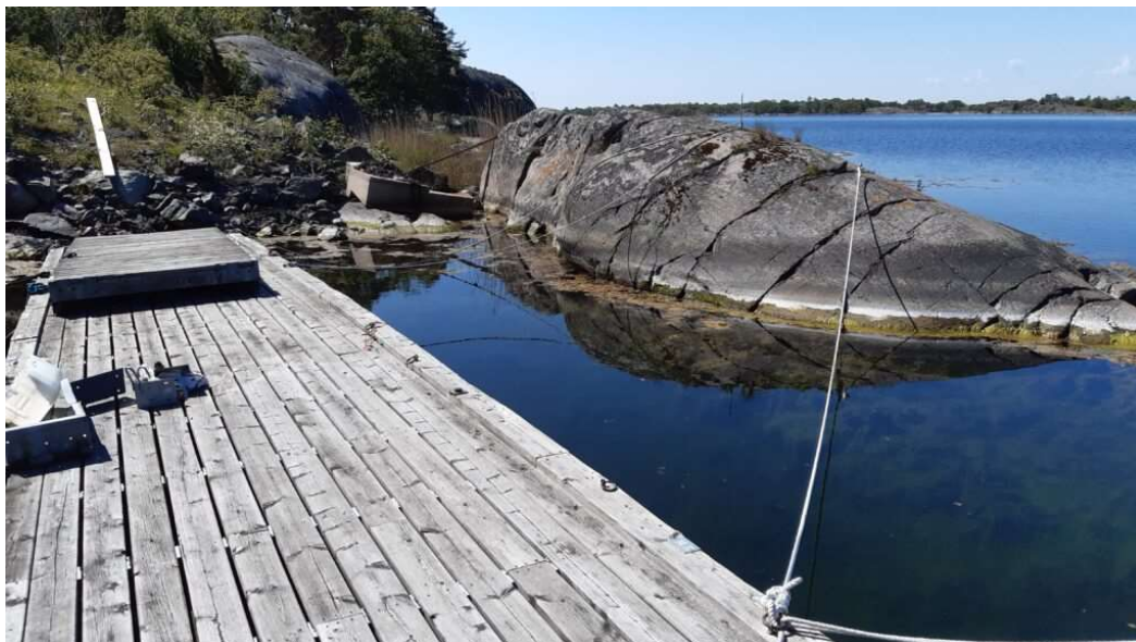
Bryggorna, som planeras läggas ut i U-form, ligger tills vidare provisoriskt fastlagda och kätting och betongklumpar för eventuell förankring av bryggan väntar på stranden.