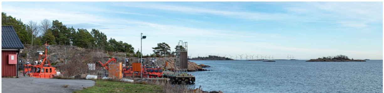
Så här redovisar Svea Vind Offshore hur det kommer se ut från Arkö-sjöräddningsstation.

Det finns inte några visualiseringar över hur vindkraftverken kommer att se ut från yttre öar i ArkipeLagets område, såsom Lundarna öster om Arkö, Kopparholmarna, Bergön och Marö Kupa. Men om man tittar på visualiseringen från Persö i Trosa skärgård, kan man få en uppfattning om hur det kan se ut. Den visualiseringen är gjord på ungefär samma avstånd, drygt en mil.